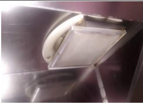
Fotografía N°5. Filtro.