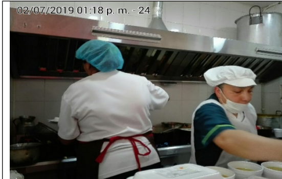
Fotografía N°3. Área de cocción.