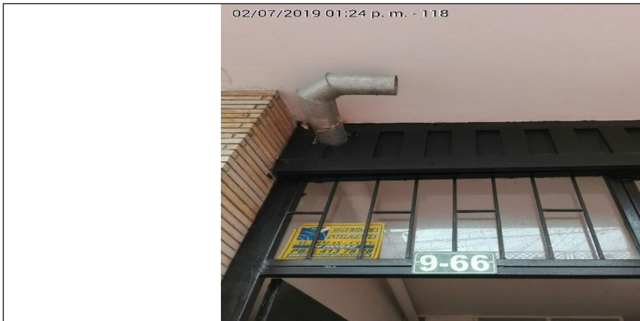
Fotografía N°7. Desfogue ducto de extracción.