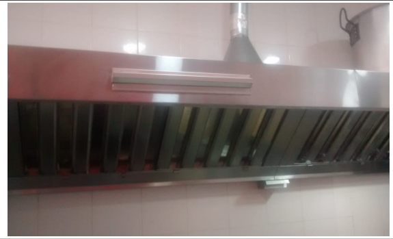
Fotografía N°4. Campana de extracción.