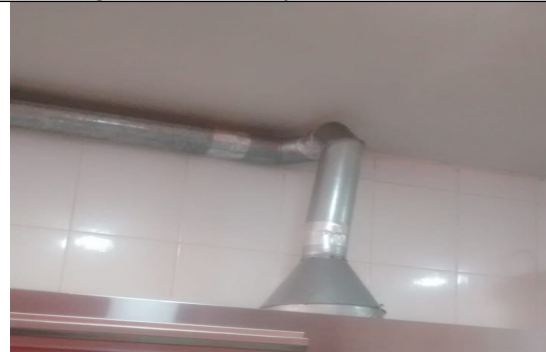
Fotografía N°6. Ducto de extracción.